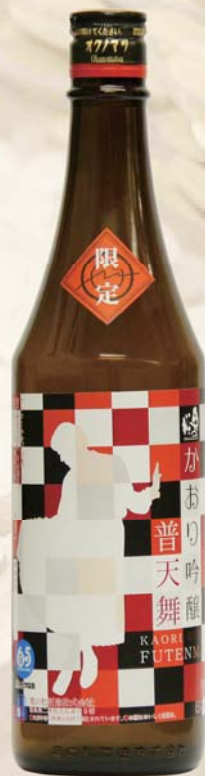
赤ラベル ※セットのみ